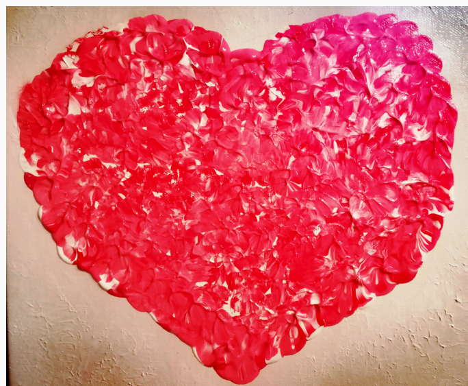
MIŁOŚĆ - "wykuta" na płótnie młotkiem.