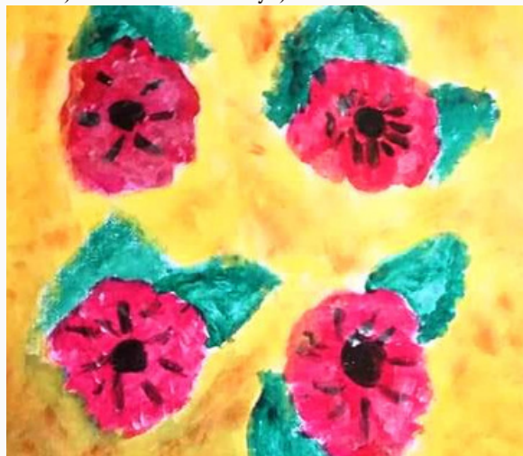
MAKI - pierwszy obraz namalowany po śmierci babci.