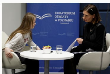
rozmawiała: Magdalena Miczek zdjęcia: Zbigniew Popieliński Kuratorium Oświaty w Poznaniu

Potencjałem oraz cennym zasobem naturalnym Wielkopolski są ludzie. Perły wielkoPolskiej oświaty to rubryka prezentująca sylwetki osób ciekawych, niezwykłych, uzdolnionych, a także zaangażowanych, pracujących z pasją, poczuciem misji i celu, tworzących wartość dodaną w swoich lokalnych społecznościach. Zapraszamy do rozmowy nauczycieli, dyrektorów, pedagogów, uczniów, rodziców. Szukamy pereł, takich jak Wy.