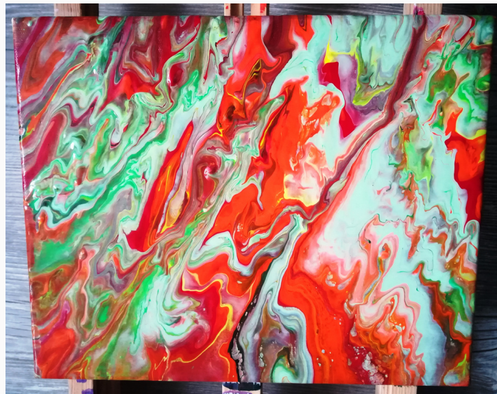
ZIEMIA - obraz подарowany królowej Elżbiecie II.